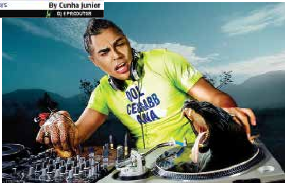
MixDynamix.com / Ban EMC

Isso tudo, não vale, nada se o cara que tocou antes de você deixou a pista naquele clima esquisito, por isso é importante saber como atuar como um DJ de Warm Up. Agora deixo 7 dicas valiosas, para se manter no topo para suas próximas apresentações: