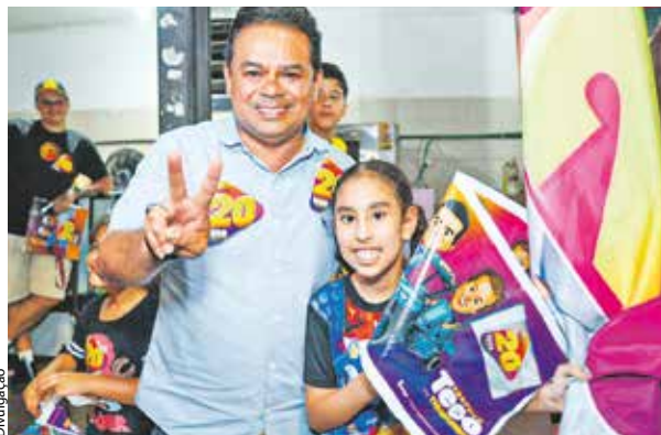
Como vice-prefeito, Teco participou ativamente da gestão que, nos últimos sete anos, entregou mais de 400 obras e ações

O nível de confiança da pesquisa é de 95% e foi encomendada pelo jornal Giro, que ouviu 504 eleitores, com idade a partir de 16 anos, entre os dias 27 e 29 de setembro em Itapevi. O levantamento também ouviu pessoas de todas as religiões e com graus de escolaridades diferentes. A pesquisa foi registrada no Tribunal Superior Eleitoral (TSE) com o nº SP-02166/2024. A margem de erro é de quatro pontos percentuais para mais ou para menos.